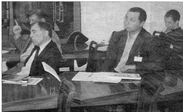
Les représentants de la profession ont accueilli les députés qui ont daigné répondre à l'invitation