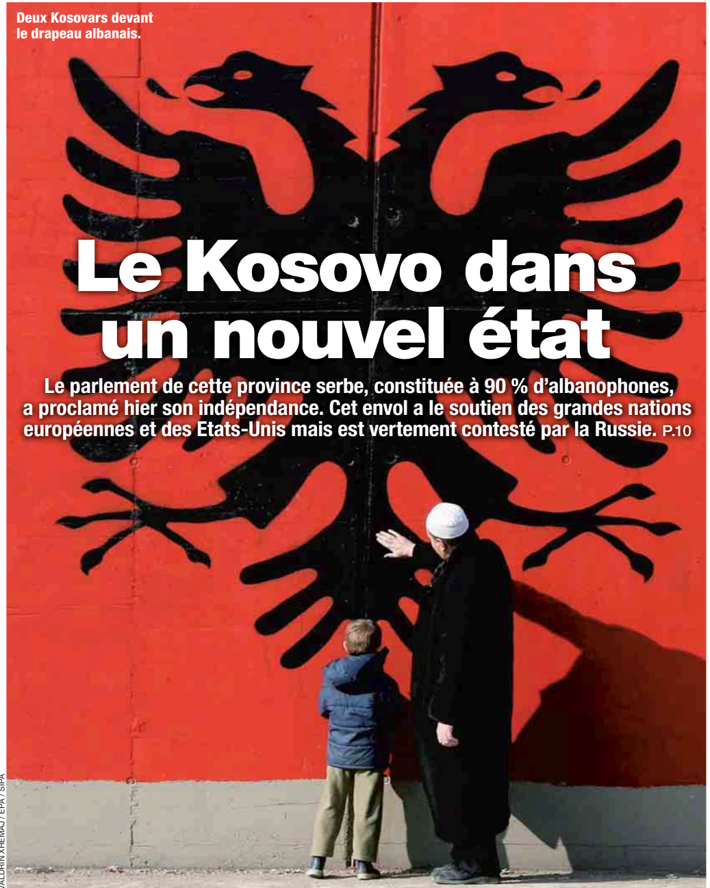
Deux Kosovars devant le drapeau albanais.